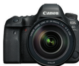
EOS 6D Mark II