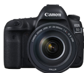
EOS 5D Mark IV